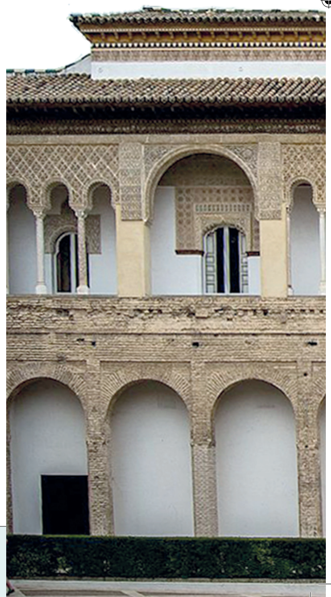
Fachada del Palacio mudéjar del Rey Don Pedro en el Alcázar de Sevilla (1364-1367).

A finales del siglo XI los almorávides terminarán por conquistar los reinos taifas, anexionando el sevillano en 1091. Durante el gobierno de los almorávides y, posteriormente de los almohades, se unifican los distintos territorios hasta la batalla de las Navas de Tolosa de 1212. Pero la memoria intercultural del antiguo reino abadí nunca se perdió del todo en Sevilla y en su tierra. Lo que justifica que Fernando III al conquistar el valle del Guadalquivir y la ciudad de Sevilla en 1248 restableciera las bases territoriales del antiguo reino abadí como entidad administrativa diferenciada en la Baja Andalucía frente a los reinos de Córdoba (1236) y Jaén (1247) y, más tarde, el nazarí de Granada (1232). Se llega así la segunda gran edad del Reino de Sevilla: la cristiano-castellana. En este periodo bajomedieval el Reino de Sevilla alcanza su verdadera extensión territorial y fronteriza con importantes ciudades y señoríos que llegaría sin modificaciones relevantes hasta 1833; un reino de importantes ciudades: Sevilla,